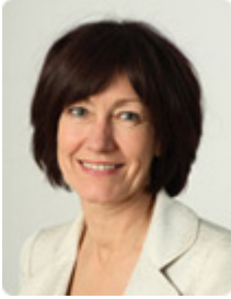
Mevrouw Laetitia Onkelinx Vice-Eerste Minister en Minister van Sociale Zaken en Volksgezondheid, belast met Maatschappelijke Integratie