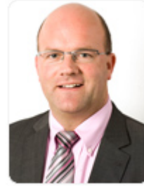
De heer Philippe Courard Staatssecretaris voor Maatschappelijke Integratie en Armoedebestrijding toegevoegd aan de Minister